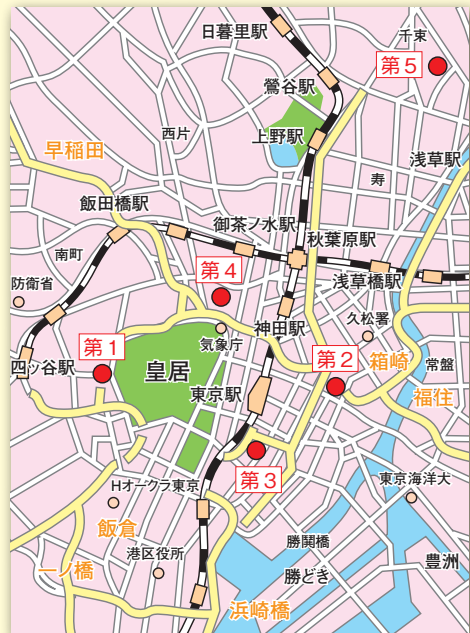
図2 電燈局の位置（現在の地図）